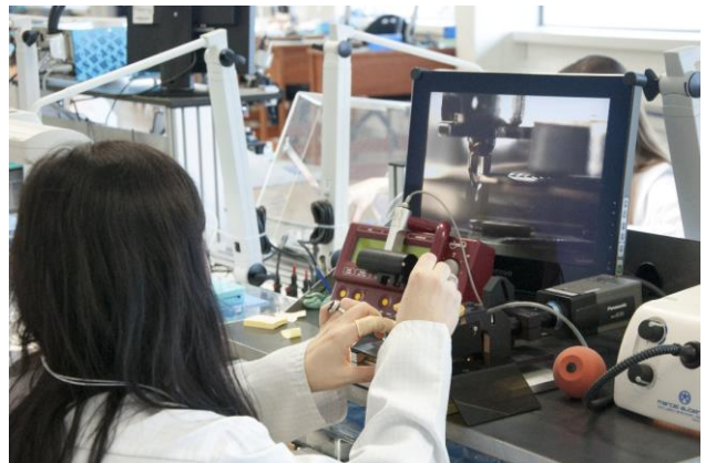
Sellita maîtrise en interne les étapes essentielles de la conception, de la fabrication et de l'assemblage de mouvements mécaniques, incluant l'organe réglant.