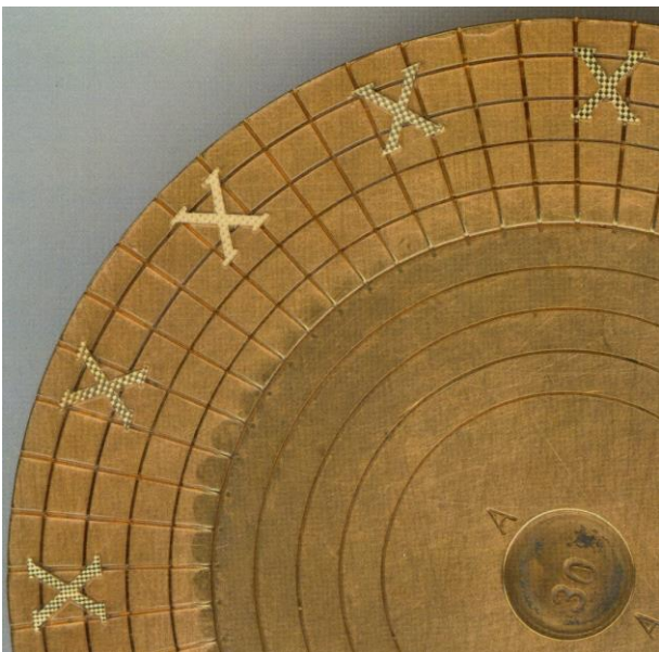
2005. Prototype de guillochage sur index.