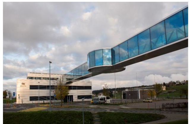
Sellita SA, La Chaux-de-Fonds et sa dernière extension en 2019.