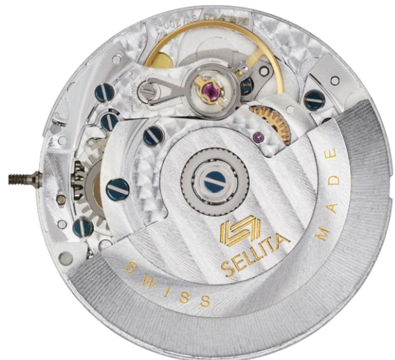
SW 200 D4. Mouvement polyvalent de 25,6 mm.