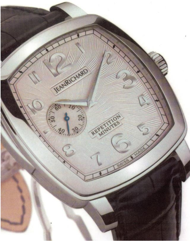
2005. Jeanrichard. Répétition minutes cadran guilloché.