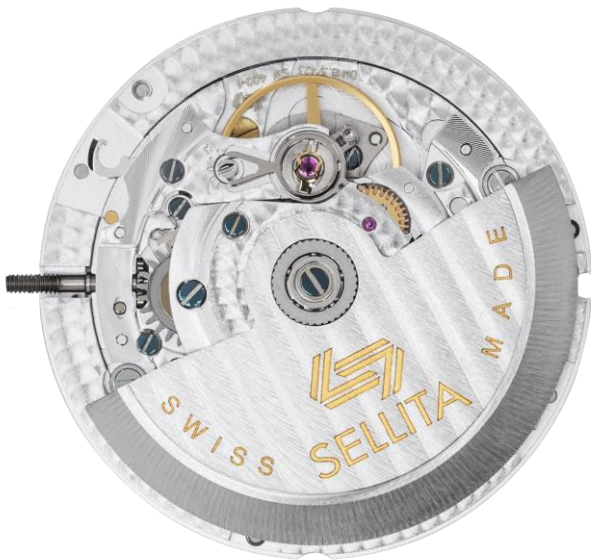
SW400 D4. Mouvement précis, fiable et robuste de 31 mm.