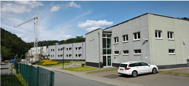
Gurofa GmbH, Altenberg.

En 2008, Sellita quitte son site historique au cœur de La Chaux-de-Fonds pour s'installer au Crêt-du-Loclé dans une nouvelle usine à la pointe de la technologie (Sellita I).