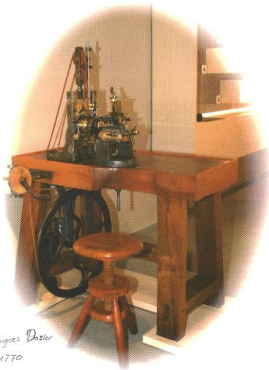
Guillocheuse ligne droite, 1770, après restauration, exposée au Musée Paysan Horloger au Boéchet.