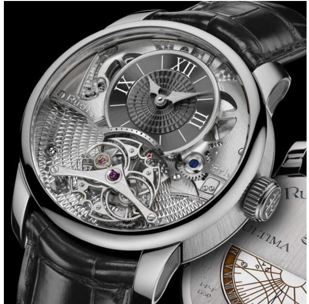
2013. Rudis Sylva