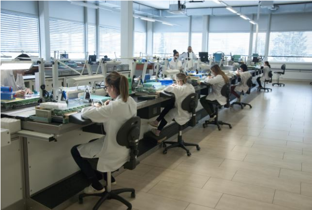
Sellita La Chaux-de-Fonds, montage.