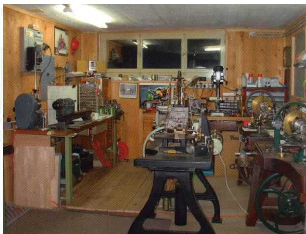
Premier atelier à domicile.

Le rachat, en 1995, de l'atelier de guillochage de Pierre Rosenberger à La Chaux-de-Fonds le propulse peu à peu sur la voie de l'indépendance. Il restaure toutes les machines à guilocher afin d'assurer la production des tapisseries et du guillochage.