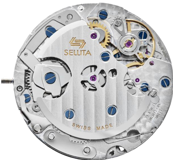
SW 500 D4. Mouvement chronographe de 30 mm.