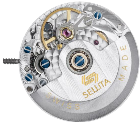
SW 100 D4. Mouvement automatique dame de 17,2 mm.

Quelques membres de la famille des calibres Sellita